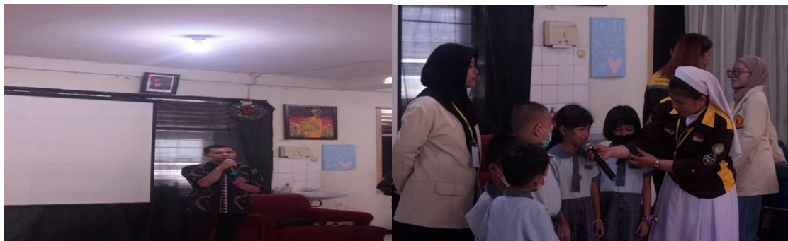
Gambar 1. Sesi Edukasi

Berikut adalah dokumentasi dari pelaksanaan kegiatan edukasi keselamatan diri pada anak usia dini di TK Living Stones Surabaya: