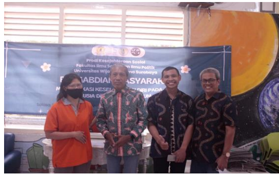
Gambar 5. Sosialisasi Modul Keselamatan Anak