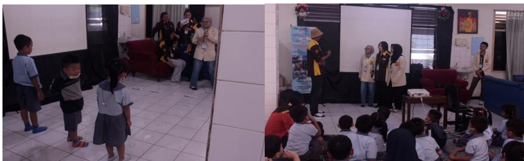
Gambar 3. Sesi Games Seru dengan Anak