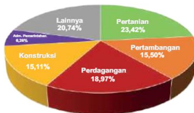
Gambar 2. Kontribusi Terbesar PDRB Menurut Lapangan Usaha (BPS Bangkalan, 2024)