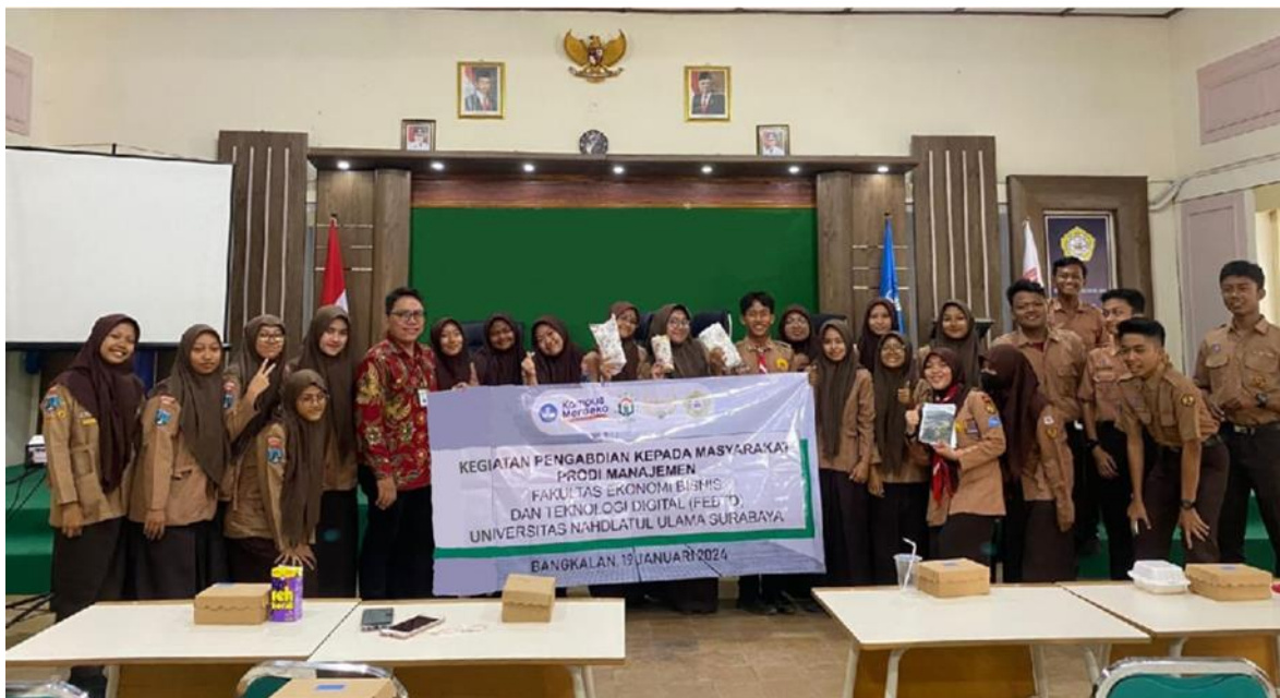
Gambar 5. Dokumentasi Foto Dosen Pengabdian dengan Siswa Audiens