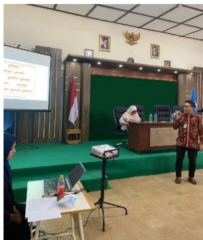
Gambar 3. Kegiatan Lokakarya, Penyampaian Materi

Sepanjang lokakarya, peserta mengikuti kegiatan pembelajaran interaktif yang menggabungkan pengetahuan teoritis dengan aplikasi praktis. Durasi 5 jam mencukupi dalam memberikan kesempatan bagi peserta untuk memahami konsep, menerapkannya pada skenario kehidupan nyata, dan terlibat dalam diskusi dengan teman sebaya sesama pelajar dan fasilitator. Selain itu, lokakarya dapat mencakup sesi tindak lanjut atau dukungan pasca-lokakarya untuk menjawab pertanyaan lebih lanjut, memberikan panduan, dan menilai kemajuan peserta dalam menerapkan praktik manajemen keuangan yang dibahas selama lokakarya, seperti terdapat pada Gambar 3, 4, dan 5.