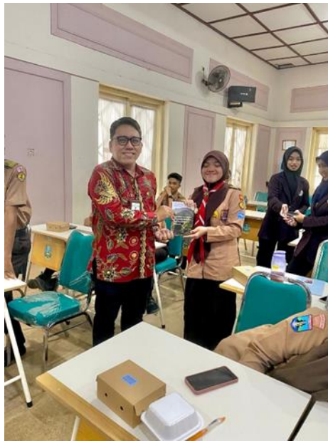
Gambar 4. Reward berupa Hadiah untuk Peserta yang Bisa Menjawab Pertanyaan