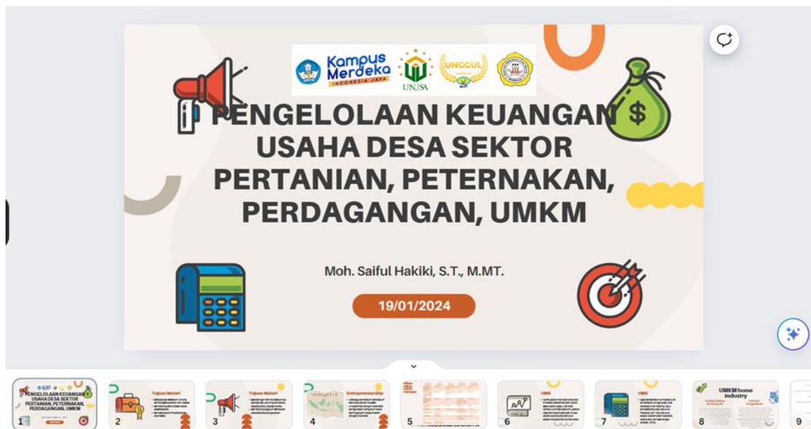
Gambar 6. Slide Presentasi Materi Pemaparan