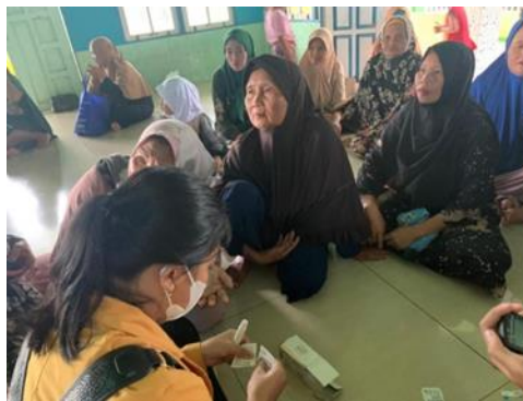
Gambar 2 Demonstrasi Pembuatan Ramuan Herbal

Pada akhir kegiatan ini dilakukan post test untuk mengevaluasi dan melihat ketercapaian dari literasi digital dan penggunaan bahan alam terkait terapi herbal (fitoterapi) di masyarakat RT 1 Desa Gudang Hirang. Adapun hasil dari post test kegiatan ini adalah sebagai berikut