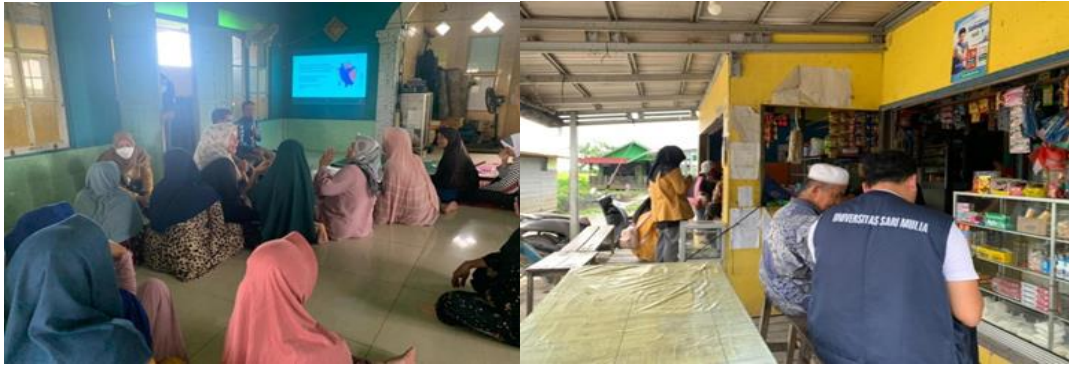
Gambar 1 Proses Pemberian Edukasi Kesehatan

pembuatan obat herbal tidak sesuai ketentuan akan berpengaruh terhadap aktifitas penggunaan obat dan cara bagaimana pengolahan dan memilih tanaman yang sesuai dengan kondisi fisiologis yang baik.