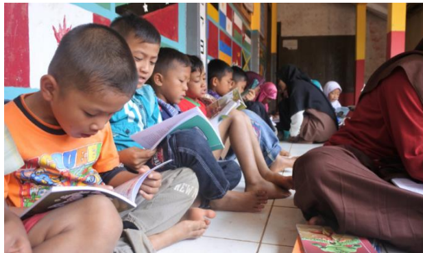
Figure 8 Provision of a Reading Garden

Anak-anak Kecamatan Maron terinspirasi untuk belajar berkat tersedianya taman bacaan. Awak KKN-PPM selalu dapat mengandalkan audiens yang bekerja keras dan berdedikasi di taman baca. Anak-anak yang memiliki akses ke taman bacaan lebih cenderung menganggap serius pendidikan mereka dan pergi ke sana setiap hari. Salah satu cara yang paling efisien dan berguna untuk membentuk keterampilan dan karakter, serta mengajar anak-anak untuk belajar sendiri, adalah melalui jadwal belajar harian yang konsisten (Hamsyahri, 2021; Winoto, 2022).