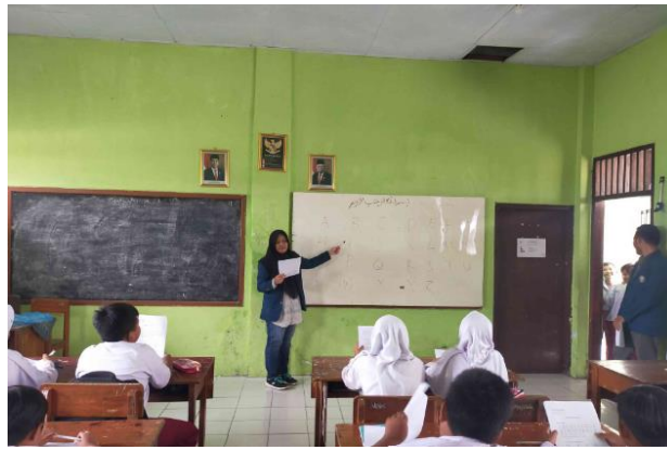
Figure 5 The team conducts teaching at SDN Gerongan

Siswa menerapkan pembelajaran kreatif di kelas dengan memanfaatkan berbagai alat pembelajaran untuk meningkatkan literasi ilmiah dan rasa ingin tahu rekan-rekan mereka. Siswa dapat memperoleh manfaat dari penggunaan media pendidikan mutakhir dalam studi mereka (Banila et al., 2021; Siagian, 2021). Jika guru memberikan siswa dengan materi yang menarik dan baru, semakin banyak dari mereka akan berharap untuk datang ke kelas (Wijaya & Hermita, 2021). Ketika sekolah memiliki sedikit sumber daya, mereka dapat memenuhi apa yang mereka miliki, misalnya dengan mengadopsi alat bantu belajar sederhana yang dapat ditemukan di lingkungan (Laila, 2021; Subakti et al., 2021). Untuk memastikan bahwa siswa sepenuhnya memahami konsep yang disajikan di kelas, alat bantu pengajaran dasar dibangun menggunakan bahan umum yang tersedia (Aulia et al., 2022; Haris, 2021).