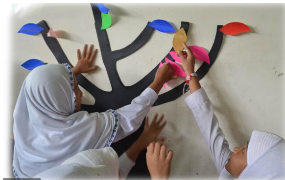
Figure 6 Installation of Papers containing Students' Goals and Work in the Dream Tree

Siswa menerapkan pembelajaran kreatif di kelas dengan memanfaatkan berbagai alat pembelajaran untuk meningkatkan literasi ilmiah dan rasa ingin tahu rekan-rekan mereka. Siswa dapat memperoleh manfaat dari penggunaan media pendidikan mutakhir dalam studi mereka (Banila et al., 2021; Siagian, 2021). Jika guru memberikan siswa dengan materi yang menarik dan baru, semakin banyak dari mereka akan berharap untuk datang ke kelas (Wijaya & Hermita, 2021). Ketika sekolah memiliki sedikit sumber daya, mereka dapat memenuhi apa yang mereka miliki, misalnya dengan mengadopsi alat bantu belajar sederhana yang dapat ditemukan di lingkungan (Laila, 2021; Subakti et al., 2021). Untuk memastikan bahwa siswa sepenuhnya memahami konsep yang disajikan di kelas, alat bantu pengajaran dasar dibangun menggunakan bahan umum yang tersedia (Aulia et al., 2022; Haris, 2021).