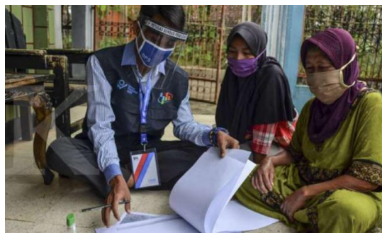
Figure 2 Occupancy Data

Pengumpulan informasi dari masyarakat lokal di Kabupaten Maron digambarkan pada Gambar 2. Tujuan utama dari sensus ini adalah untuk mengetahui jumlah penduduk saat ini dan untuk mempelajari lebih lanjut tentang literasi dan keterampilan Calistung masyarakat.