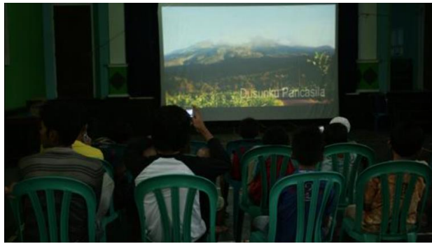
Figure 7 Educational Film Screening