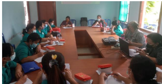
Figure 3 Socializing

Anggota masyarakat dan anak-anak dipertemukan di balai desa untuk mengikuti kegiatan sosialisasi pendidikan. Anak-anak muda dan penduduk setempat sama-sama menyukai berbagai hal dan bergabung dengan penuh semangat. Empat puluh tiga orang berpartisipasi dalam acara pembangunan komunitas ini. Keingintahuan dan minat mereka untuk belajar tentang pendekatan yang berbeda untuk sekolah sangat terasa. Mereka memiliki dorongan untuk mendaftarkan anak-anak mereka dalam program pendidikan yang lebih ketat. Setiap peristiwa penting juga menghadirkan peluang untuk interaksi sosial. Siswa diberikan alat tulis gratis dan mengikuti kegiatan sosialisasi pendidikan. Latihan ini dimaksudkan untuk mendorong siswa untuk mengambil peran lebih aktif dalam pendidikan mereka.