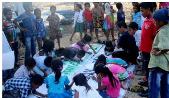
Figure 4 Teaching Literacy to Children at Command Posts and in the Outdoors

Gambar 4 menggambarkan tindakan selanjutnya yang dilakukan yaitu meningkatkan literasi di kalangan warga Kecamatan Maron. Calistung harus menjadi bagian dari kurikulum keaksaraan dasar setiap anak. Anak-anak diajar setiap hari sepulang sekolah, di tengah pos Kegiatan. Siswa lebih terlibat dalam pendidikan mereka ketika mereka diajar di luar kelas. Memotivasi dan mendidik anak-anak di luar kelas dapat memiliki efek positif (Hartanti & Kurniawan, 2022; Pertiwi et al., 2021). Badan mahasiswa secara keseluruhan menampilkan semangat akademis yang sehat. Memotivasi dan mendidik murid di luar pengaturan kelas tradisional.