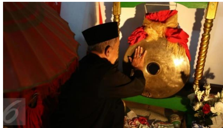
Gambar 2. Pertunjukan Kesenian Musik Tradional Gong Si Bolong