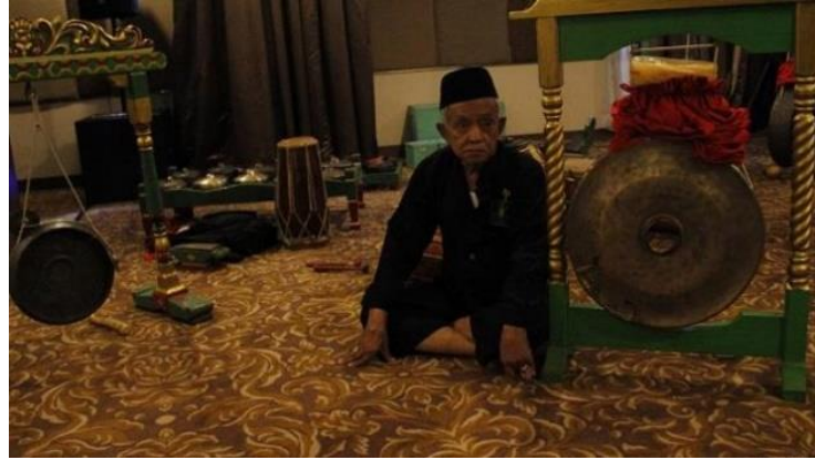
Gambar 1. Latar Belakang Alat-Alat Kesenian Musik Tradional Gong Si Bolong

sekitar di lokasi pertunjukan, sehingga penonton dapat dengan leluasa memilih makanan atau minuman yang dibeli sambil menunggu pertunjukan dimulai atau sambil menonton saat pertunjukan telah dimulai. Dalam hal ini tidak hanya penonton pertunjukan saja yang diuntungkan, namun para penduduk sekitar juga diuntungkan karena adanya pertunjukan ini memberikan nilai ekonomi tersendiri karena mereka dapat berjualan di lokasi pertunjukan.