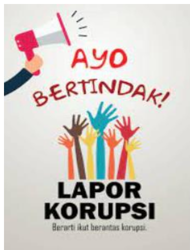
Gambar 3. Poster Antikorupsi

Poster antikorupsi dibagikan ke sekolah-sekolah sebagai bagian dari kampanye pembiasaan untuk membiasakan siswa dengan masalah ini. Pembiasaan berjalan dengan baik karena poster disesuaikan dengan kebutuhan dan keadaan masing-masing siswa, dipasang di lokasi yang strategis, dan mudah dijangkau. Semangat antikorupsi diharapkan dapat ditanamkan dalam dirinya sejak dini melalui paparan poster antikorupsi yang terus menerus.