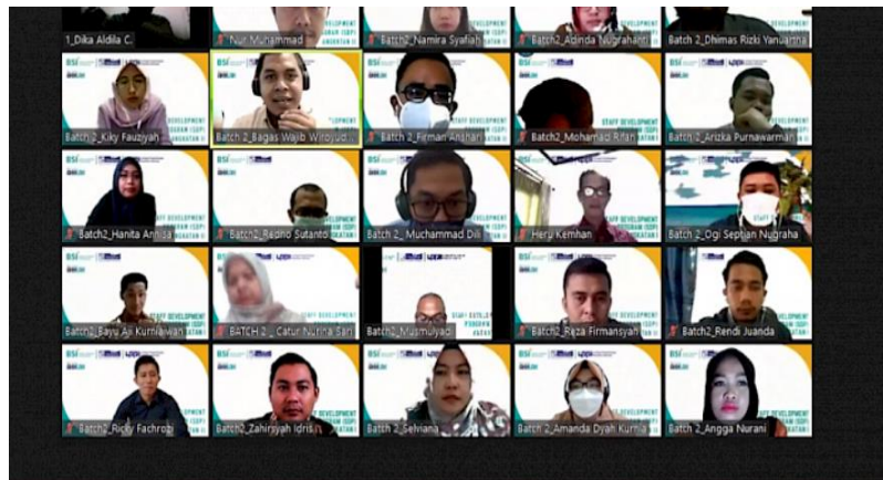
Gambar 2. Penyuluhan Wawasan Kebangsaan