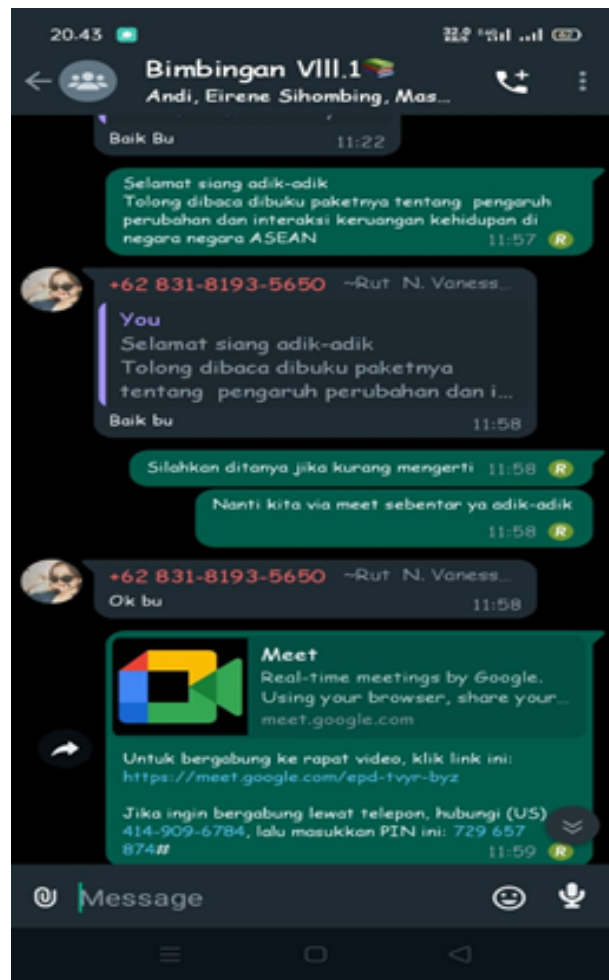
Gambar 4. Dokumentasi kegiatan diskusi online dalam pembelajaran mata pelajaran Ekonomi