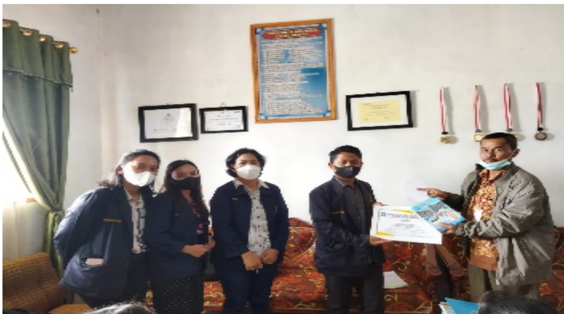
Gambar 5. Penjemputan Tim PkM mahasiswa UHN oleh DPL bersama Kepala SMP Negeri 2 Lintongnihuta