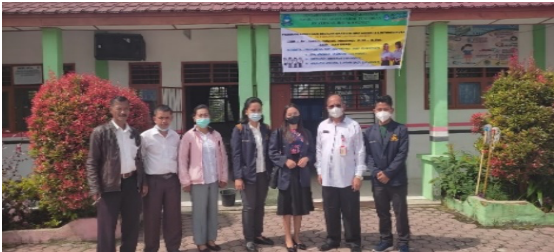
Gambar 1. Penerjunan mahasiswa PkM oleh DPL bersama Kepala SMP Negeri 2 Lintongnihuta