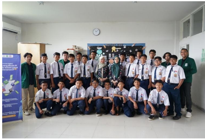
Gambar 3. Dokumentasi Akhir Kegiatan Sosialisasi