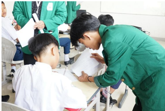
Gambar 1. Pelaksanaan Pre – Test pada Siswa

Data pre-test dan post-test menunjukkan adanya peningkatan rata-rata nilai siswa dari 85,42 menjadi 96,28. Meskipun peningkatan terlihat kecil, hal ini mengindikasikan penguatan pengetahuan siswa, khususnya dalam memahami konsep digital entrepreneurship, strategi branding, serta monetisasi media sosial. Pemberian pre-test didokumentasikan pada Gambar 1.