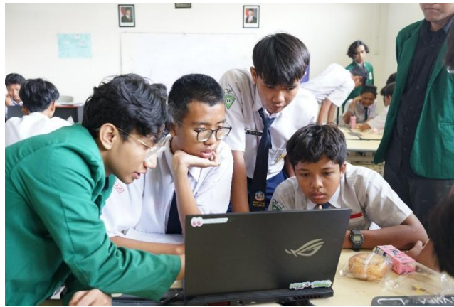
Gambar 2. Pendampingan oleh Tim Mahasiswa