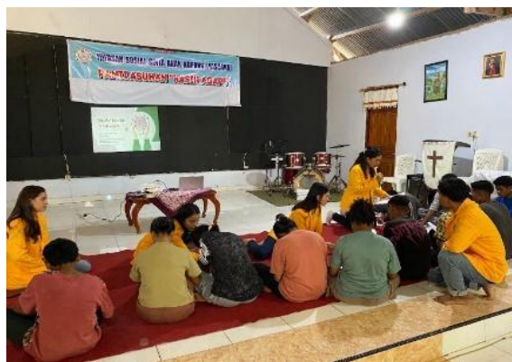
Gambar 2. Psikoedukasi Tentang Kesadaran Kesehatan Mental

Pada hari pertama, kegiatan dibuka dengan sesi psikoedukasi, art therapy pertama, dan sesi konseling sebaya oleh komunitas mentalmate.id dan anggota tim intervensi psikososial. Semua peserta terlibat aktif dalam mengikuti ketiga sesi ini. Saat sesi psikoedukasi, peserta menunjukkan konsentrasi yang tinggi terhadap materi yang dibawakan. Pada sesi ini, tim intervensi membawakan materi tentang kesadaran kesehatan mental, guna menumbuhkan sikap peduli dan mengenali kondisi kesehatan mental secara pribadi. Selanjutnya, saat sesi art therapy pertama semua peserta juga antusias untuk melaksanakan teknik terapi tersebut. Pada sesi ini, penggunaan art therapy yaitu menggambar secara langsung dijadikan sebagai teknik utama untuk mengeksplorasi kondisi kesehatan mental peserta dan sebagai media selama sesi konseling sebaya. Begitupun pada sesi konseling, seluruh peserta dapat memulai untuk menceritakan pengalaman mereka terkait kondisi kesehatan mental yang dialami serta makna dari hasil gambar art therapy yang digunakan.