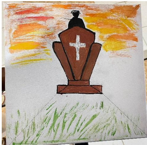
Gambar 7. Art Therapy dari Proses Melukis oleh Kelompok 1

Dalam sesi art therapy kelompok 2 di atas, pada sisi sebelah kanan atas digambar oleh peserta SN yang melukis sebuah lapangan bola. Gambar tersebut menunjukkan lapangan sederhana dengan gawang, bola kaki, dan beberapa teman-temannya yang sedang bermain. Melalui gambar ini, terlihat bahwa bermain bola menjadi salah satu kegiatan yang membuatnya bahagia. Peserta ini melukiskan momen kebersamaan dengan teman-temannya di panti asuhan, yang mungkin menjadi sumber kenyamanan dan kebahagiaan selama tinggal di lembaga tersebut. Gambar ini juga menunjukkan kebutuhan peserta SN akan kebahagiaan, interaksi sosial, dan ruang untuk mengekspresikan dirinya di tengah keterbatasan lingkungan. Lapangan bola menjadi pelarian positif ketika mereka merasa bosan di dalam panti asuhan.