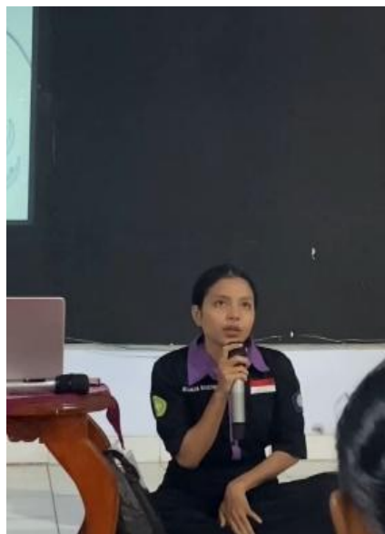
Gambar 6. Psikoedukasi Tentang Self-Care dan Psikologi Perdamaian

Pada hari ketiga, kegiatan intervensi dilanjutkan dengan sesi psikoedukasi tentang self-care dan peran psikologi perdamaian dalam mengatasi konflik di panti asuhan, sesi art-therapy 3 tentang kebahagiaan selama tinggal di panti asuhan, dan pameran hasil art-therapy. Pada hari ketiga ini, seluruh peserta terlibat aktif selama sesi psikoedukasi yang ditunjukkan melalui diskusi terbuka tentang teknik self-care yang biasa mereka lakukan. Selain itu saat sesi art-therapy, keterlibatan aktif peserta meningkat, karena dibagi dalam dua kelompok untuk melukis. Saat sesi pameran, semua peserta secara aktif menceritakan hasil art-therapy yang telah dilakukan selama tiga hari kegiatan intervensi.