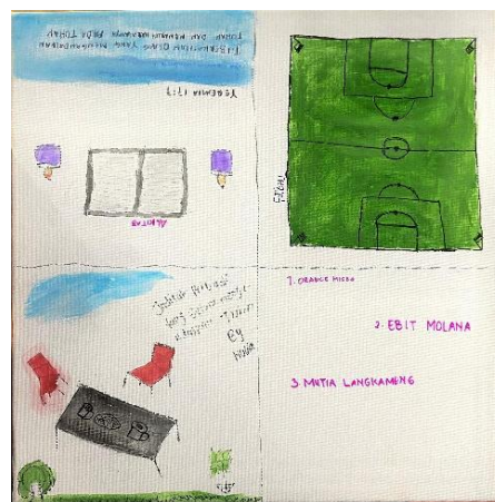
Gambar 8: Art Therapy dari Proses Melukis oleh Kelompok 2

Dalam sesi art therapy kelompok 2 di atas, pada sisi sebelah kanan atas digambar oleh peserta SN yang melukis sebuah lapangan bola. Gambar tersebut menunjukkan lapangan sederhana dengan gawang, bola kaki, dan beberapa teman-temannya yang sedang bermain. Melalui gambar ini, terlihat bahwa bermain bola menjadi salah satu kegiatan yang membuatnya bahagia. Peserta ini melukiskan momen kebersamaan dengan teman-temannya di panti asuhan, yang mungkin menjadi sumber kenyamanan dan kebahagiaan selama tinggal di lembaga tersebut. Gambar ini juga menunjukkan kebutuhan peserta SN akan kebahagiaan, interaksi sosial, dan ruang untuk mengekspresikan dirinya di tengah keterbatasan lingkungan. Lapangan bola menjadi pelarian positif ketika mereka merasa bosan di dalam panti asuhan.