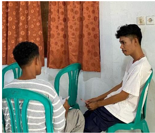
Gambar 3. Hasil Gambar Art Therapy I Tentang Eksplorasi Diri

Peserta FT menyampaikan bahwa gambar pohon yang gugur menceritakan tentang kehidupan yang dia alami. Daun dari pohon tersebut mulai layu dan jatuh ke tanah, yang diinterpretasikan sebagai bentuk perasaan yang dialami peserta FT.